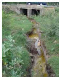
Ranipet, in India: altissimo inquinamento da cromo esavalente (Internet)

NEW YORK (Stati Uniti) – Esistono posti nel mondo che assomigliano a gironi danteschi, luoghi dove è normale che il 90 per cento dei bimbi soffra di asma infantile e dove l'aspettativa di vita è uguale grosso modo a quella che esisteva nel medioevo. Nella classifica redatta dall'associazione ambientalista americana Blacksmith Institute tra i primi 10 di questi posti tre figurano in Russia, uno in Cina, uno in Repubblica Dominicana, India, Kirgizistan, Perù, Ucraina e Zambia. La triste classifica considera la natura delle sostanze