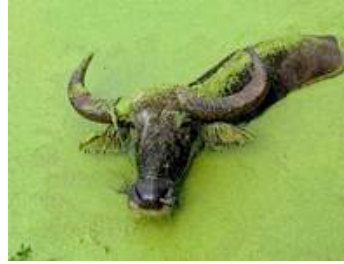
Im Osten Chinas steht ein Büffel im verseuchten Wasser des Hefei-Flusses.

Seit über 30 Jahren produzieren diese Gerbereien täglich 30 Millionen Liter hochgiftige Abwässer, die unkontrolliert ins Umland abgelassen werden. Die dort arbeitenden Menschen sind nach Recherchen der "Tageszeitung" 175 verschiedenen Chemikalien, Salzen und Säuren ausgesetzt. Der Zeitung zufolge wird in Ranipet unter anderem für Salamander, Sioux, Nike und Europas größten Schuhhändler Deichmann produziert.